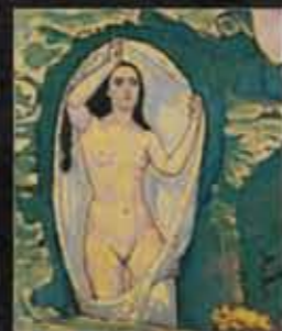
Kolo MOSER, VENERA v jami, 1914 © Muzej Leopold, Dunaj

„Moč besed“ je v pliberškem muzeju Werner Berg postavljena nasproti „Moči slike“. Obiskovalec izve, kako so veliki avstrijski umetniki 20. stoletja v svojih slikah uspeli prikazovati vizije transcendence in božanstva.