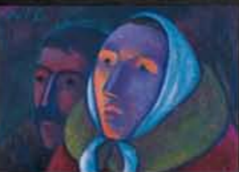
Werner Berg, Pred vsajanjem, 1965 © Muzej Werner Berg

Prikazana stališča zajemajo raznolike, vendar v nobenem smislu zgolj krščanske znake osebnega verovanja. Zajemajo tudi fantastično