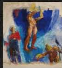
Anton Kolig, Entschwebung ('Dvig'), okoli 1923

vizionarno in krivoverno samomučenje s staro, presegajočo, baročno-katoliško tradicionalno podobo in nazorom.