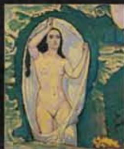
Kolo MOSER, VENUS in the grotto 1914, © Leopold Museum, Vienna

Alla "forza della parola" si contrappone la "forza dell'immagine" nel Werner Berg Museum di Bleiburg, dove il visitatore apprende in che modo grandi artisti austriaci del XX secolo sono riusciti a rappresentare nei loro quadri visioni della divinità e della trascendenza.