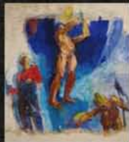
Anton Kolig, Entschwebung ("Levitazione"), ca. 1923

auto-flagellatori eretici di un'antica tradizione iconografica e concettuale barocco-cattolica che supera i confini.