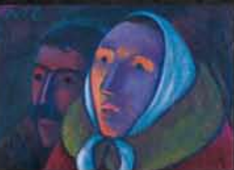
Werner Berg, Davanti alla resurrezione, 1965 © Werner Berg Museum

Fra le posizioni rappresentate figurano molteplici - assolutamente non solo cristiani - simboli di fede personale, ma anche fantastici visionari ed