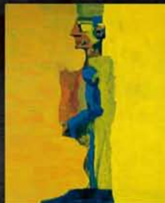
Hubert Schmalix, Alphaomega large IV, 1994

È questa la domanda centrale della mostra. Particolare considerazione assume in quest'ambito l'opera di Werner Berg abitualmente ospitata nel museo. Il nuovo giardino scultoreo raccoglie inoltre per la prima volta alcuni capolavori della scultura contemporanea.