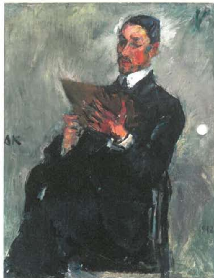
Anton Kolig, Beroči, 1912 (Salzburger Museum Carolino Augusteum)