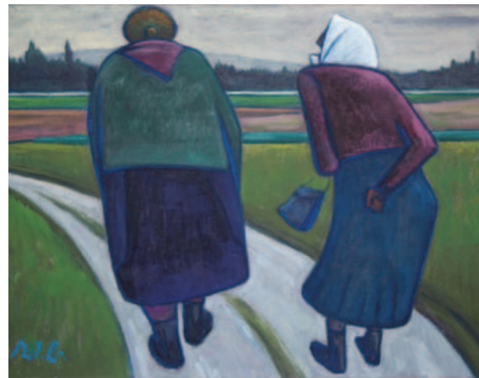
WERNER BERG, Dve ženski na poti, 1974

Slike Eggerja-Lienza, Waldeja in Berga so aktualne, ker so se z vednostjo o svetovnih in umetnostnih dogodkih njihovega asa vsebinsko spopadli z regionalnostjo. Njihove slike izrazito →