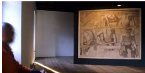
Muzej mesta Lienz – grad Bruck

Poleg razstave del Albina Eggerja-Lienza v izrednem grajskem ambientu vsako leto predstavljajo nestalne posebne razstave in dela sodobnih umetnikov. Na območju zunanega dvoriš a gradu Bruck