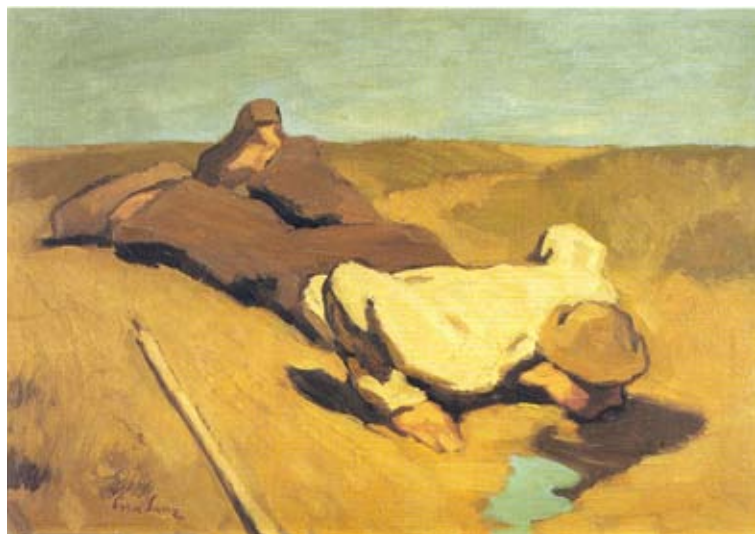
ALBIN EGGER-LIENZ, Izvir, 1924

Trije slikarji, tri pokrajine. Albin Egger-Lienz (1868-1926), Alfons Walde (1891-1958) in Werner Berg (1904-1981) so vidni predstavniki avstrijske moderne. Kljub razli nemu poreklu, razli nim letnicam rojstva in izobrazbi jih združuje naslednje: njihovo delovanje v regijah stran od urbanih umetniških središ prve polovice 20. stoletja. →