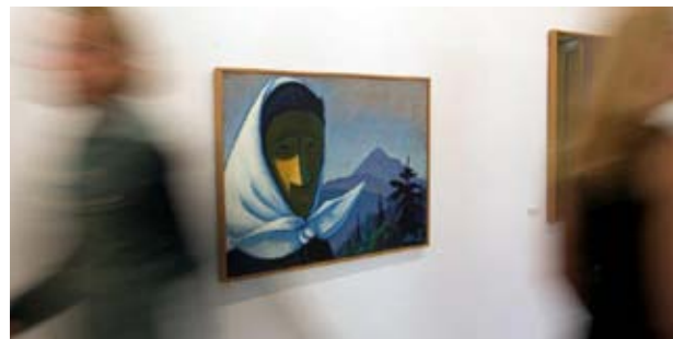
Muzej Wernerja Berga, fotografija: Karlheinz Fessel

Muzej Wernerja Berga je postal pravi magnet za ljubitelje umetnosti iz cele Evrope. Nudi stalno razstavo, ki obsega ve kot 150 oljnih slik, lesorezov in risb umetnika, rojenega leta 1904 v Wuppertalu Elberfeldu, ki se je leta 1931 naselil na Rutarjevi doma iji na južnem avstrijskem Koroškem, kjer je do svoje smrti leta 1981 s svojo družino živel kot kmet in slikar. Njegova dela so tudi edinstven dokument njegove nove domovine južne avstrijske Koroške. Z ob utkom obnovljeno stoletja staro poslopje na glavnem trgu v Pliberku nudi idealno okolje za umetnostna dela. Premišljena razširitev, ki obsega dvorano z nadsvetlobo na območju dvoriš a,