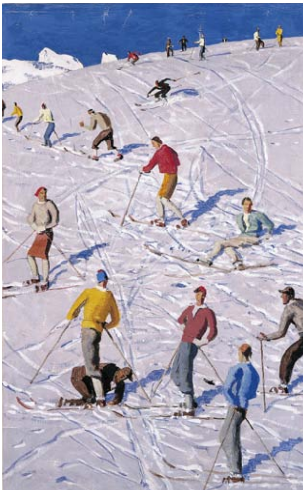
ALFONS WALDE, Pobo je za za etnike, okrog leta 1925

→ Lienz in pusta dolina Ötztal, položne planine „Kitzbüheler Alpen“ ter melanholi na južna avstrijska Koroška, zaznamovana s skupnim življenjem nemško in slovensko govorega prebivalstva, so bile pokrajine in bivališ a, ki so odlo ilno vplivala, tako po motivih kot tudi formalno, na umetniško ustvarjanje teh treh slikarjev. Po izobraževanjih in daljših bivanjih na Dunaju, v Münchnu in Weimarju so Albin Egger-Lienz, Alfons Walde ter Werner Berg dalje razvijali svoja dela na umetniškem obrobju podeželskih regij pod vplivom pokrajine in v njej žive ih ljudi. Berg je od leta 1930 živel na svoji samotni kmetiji Rutarhof na jugovzhodu avstrijske Koroške, Egger-Lienz najprej na Vzhodnem Tirolskem, v kraju Längenfeld v dolini Ötztal, po svoji vrnitvi iz Weimarja od leta 1913 →